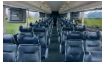
▲ Beispiel Bestuhlung

Zum Abschluss der Tour laden wir Sie herzlich zu einem Farewell-Dinner ein.