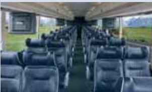
▲ Beispiel Bestuhlung

Wer sich das „gewisse Etwas“ an zusätzlichem Komfort gönnen möchte, fährt mit unseren Komfort-Touren genau richtig!