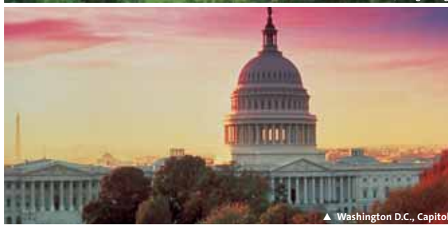
▲ Washington D.C., Capitol