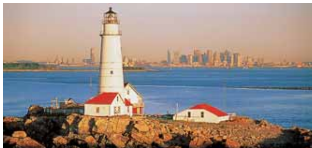
▲ Boston, Leuchtturm