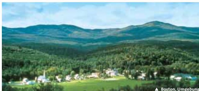
▲ Boston, Umgebung